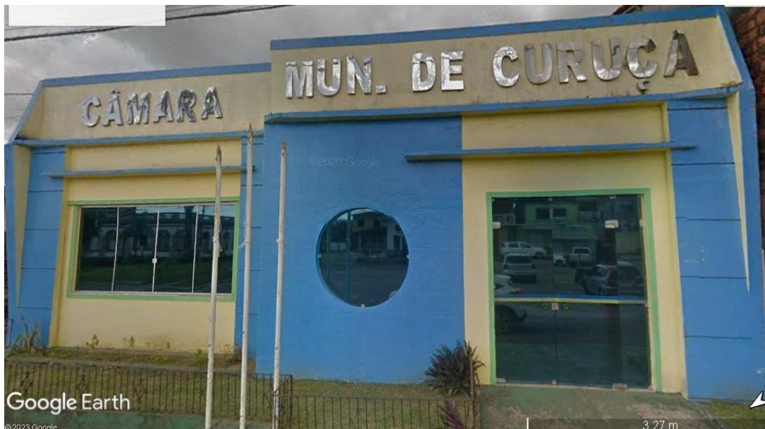
Foto da fachada

Praça Coronel Horácio, S/Nº, Bairro Centro, Curuçá- PA.